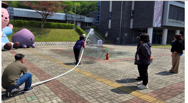
소화전 사용법 실습교육