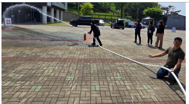
소화전 사용법 실습교육