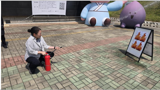
소화기 사용법 실습교육