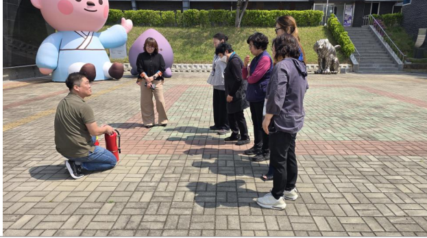
소화기 사용법 교육(소방안전관라자)