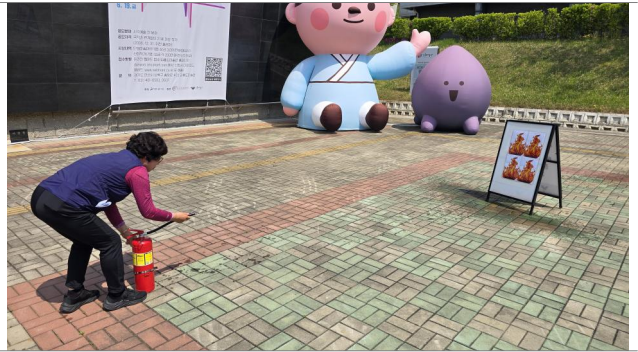
소화기 사용법 실습교육