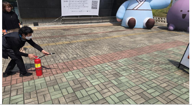
소화기 사용법 실습교육