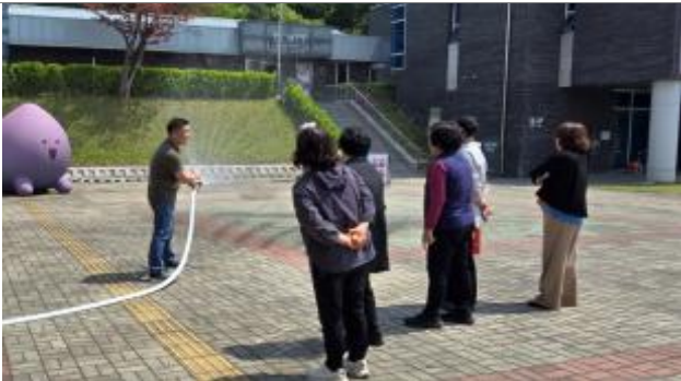
소화전 사용법 교육(소방안전관라지)