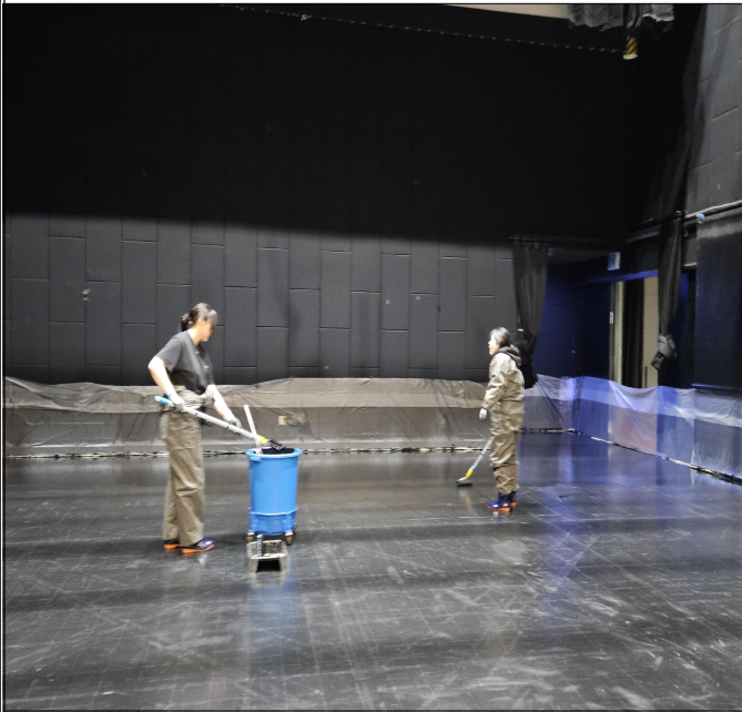
무대바닥 도색 1차